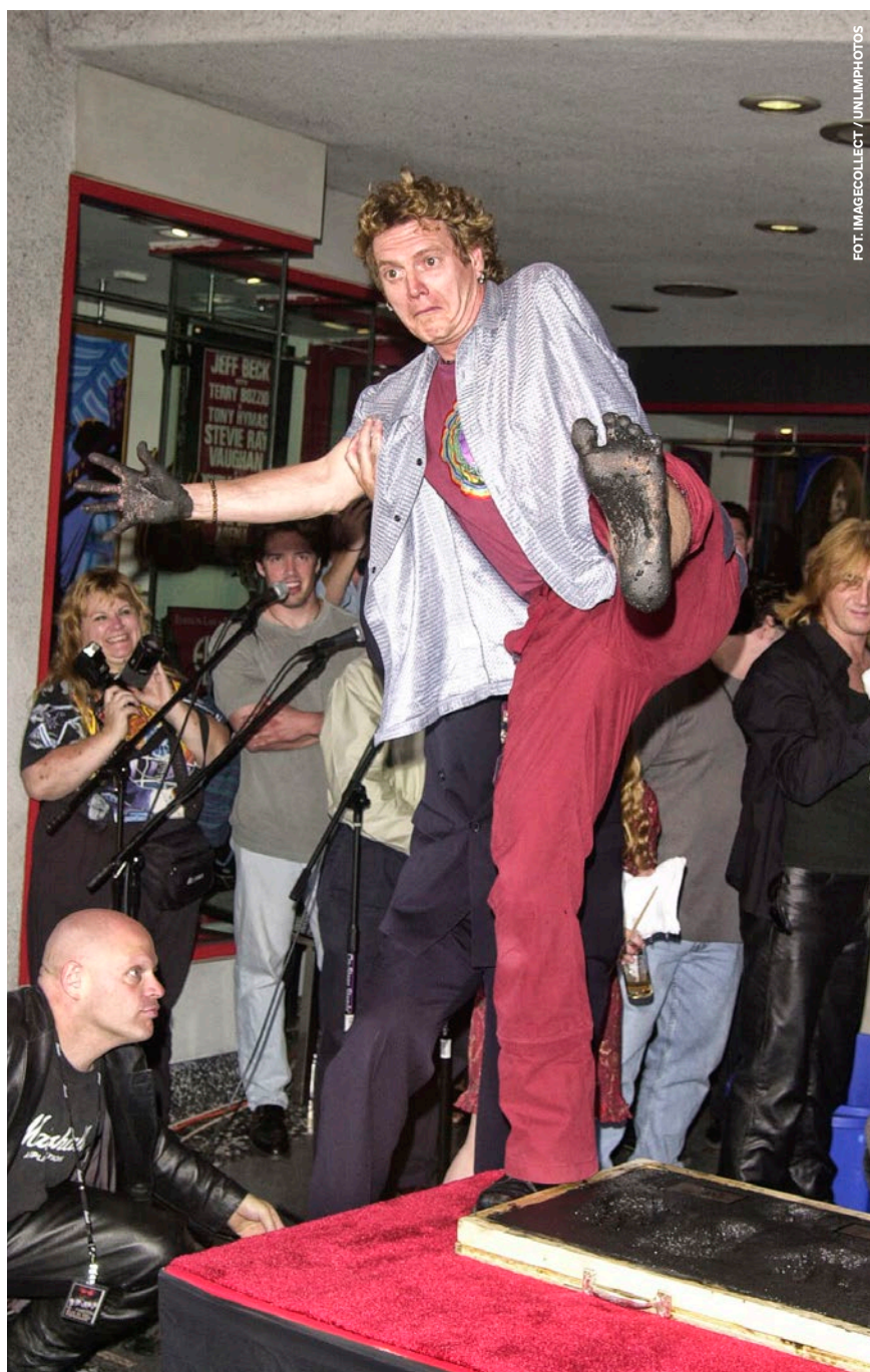
A Rick Allen z Def Leppard podczas ceremonii na Rockwalk Susek Blvd. 5 września 2000 roku

Rick Allen przyznaje, że przez jakiś czas po wypadku nie miał siły ani nadziei na dalsze życie. „Przeżycie wypadku samochodowego i utrata ręki